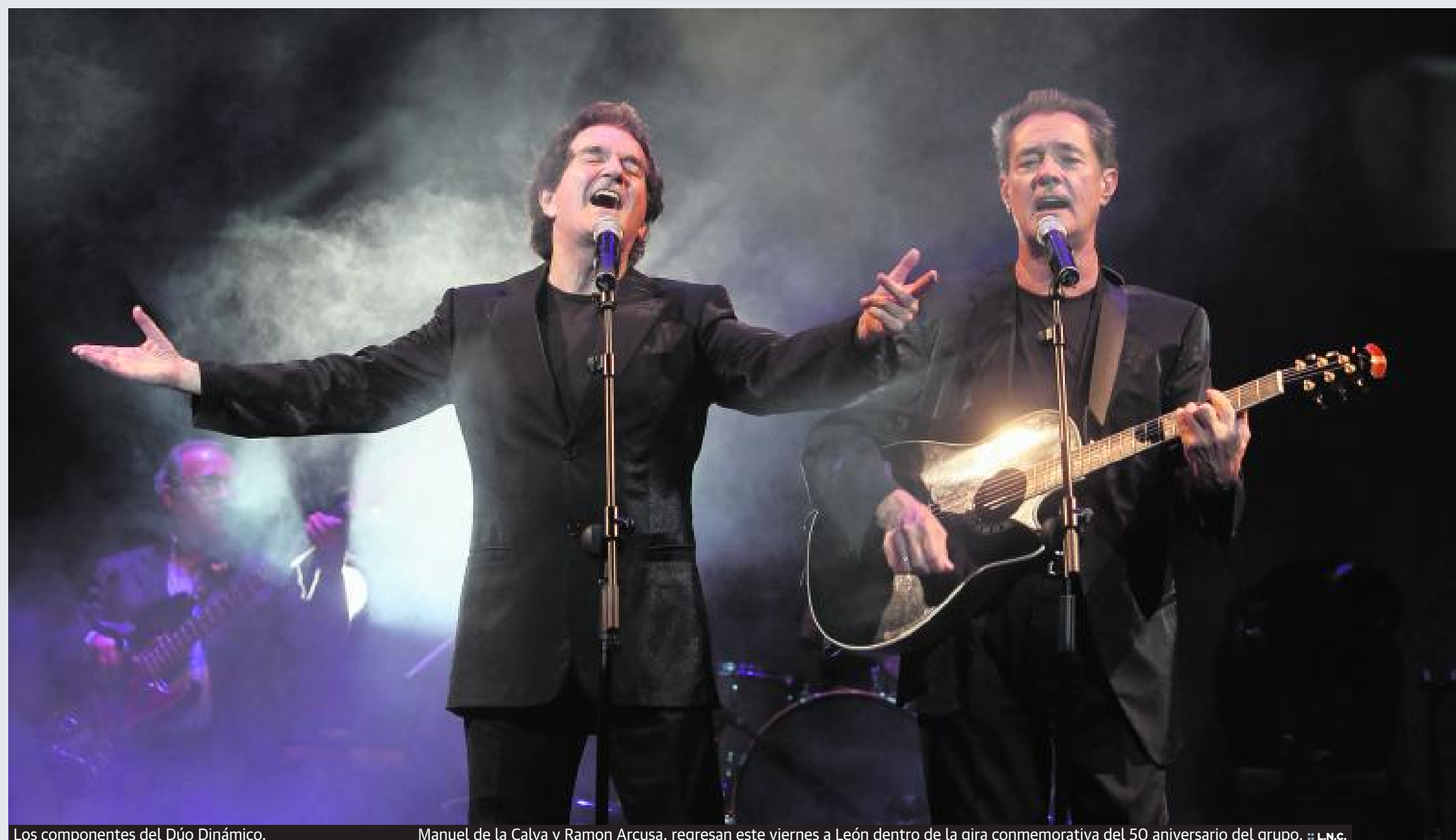
Los componentes del Dúo Dinámico,